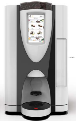
LEI SA RY TOUCH 7" FV