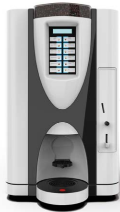
LEI SA RY EASY