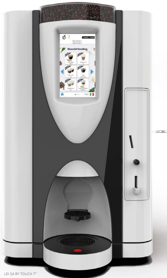
LEI SA RY TOUCH 7"

LEI SA RY, una máquina expendedora semiautomática de OCS (Office Coffee Service) que ofrece café en todas sus variedades de sabor.